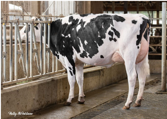
PROGENESIS MIRAND HOTSTUFF P DAM